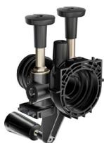
Anschlussmodul softliQ mit Wandabstützung