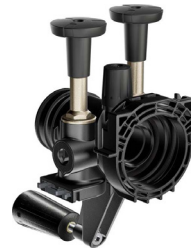
Anschlussmodul softliQ mit Wandabstützung